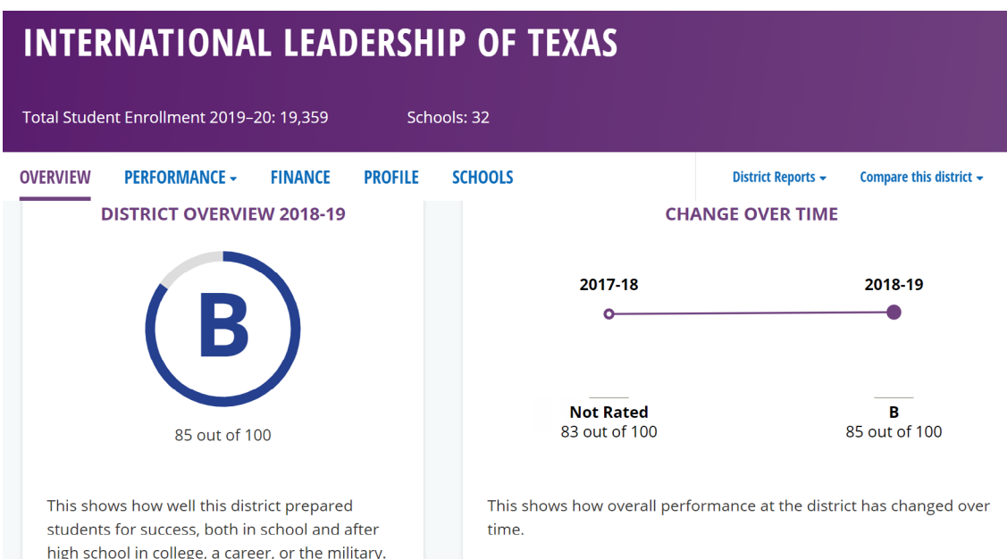
IL Texas 學校表現績效表

然而從該校的課程架構來看，這所學校事實上標示著三語教育，而語言的教學銜接，如果早上用西班牙語上課，下午就用英語上課，內容是銜接的，不是重複的。所以學校裡的老師必須是團隊備課，才能互相銜接。