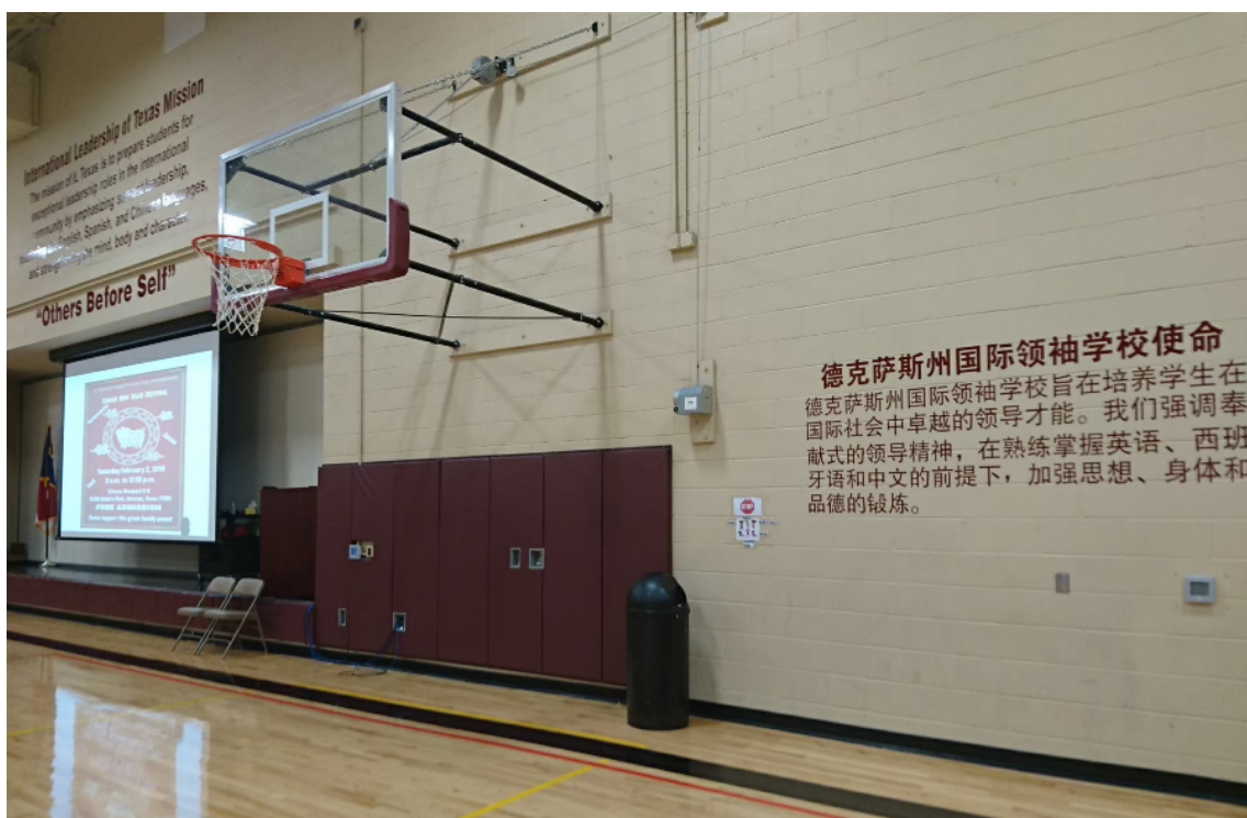
IL Texas 的學校使命就標示在牆上

德克薩斯州推動雙語課程原因是：該州出口的前三個國家分別是墨西哥，加拿大和中國。因此德州認為要為當今的國際世界做好準備。在 IL Texas，所有學生都有機會學習英語，西班牙語和中文，IL Texas 的學校使命就標示在牆上：